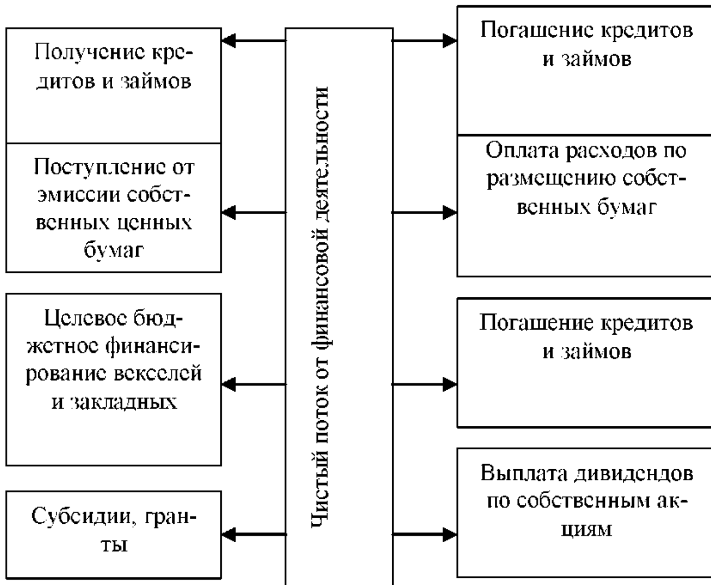
Рисунок 2. Потоки денежных средств от финансовой деятельности

В финансовую деятельность предприятия под притоком денежных средств понимается [25, с. 167]: