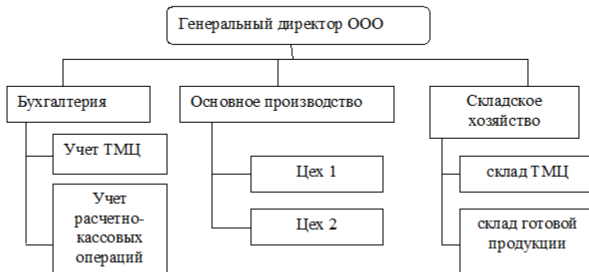
Рисунок 5. Организационная структура управления